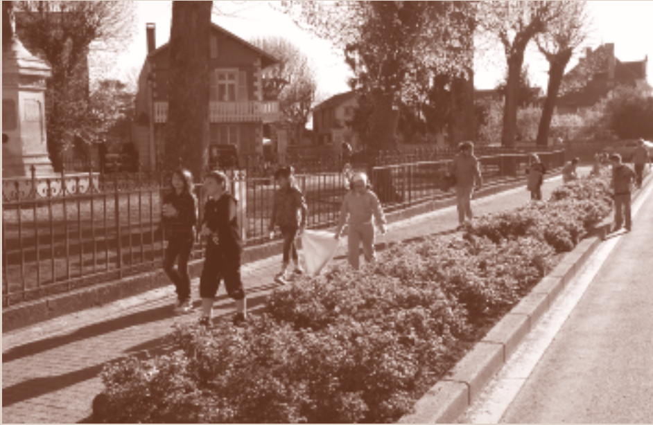
Exemple à suivre...